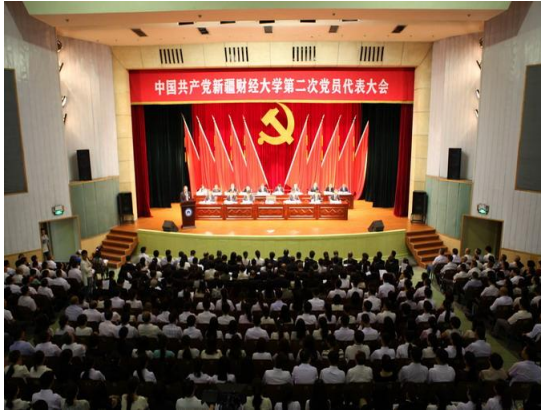
学校第二次党代会胜利召开