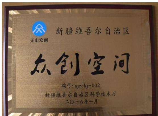
我校“逐梦创客”获批自治区首批众创空间

学校设立了专门负责大学生就业创业工作的独立机构创新创业服务中心，同时成立了虚拟设置、准市场化运营的创业学院。投入3000平米进行众创空间基地建设，积极开展众创空间“逐梦创客”的规划论证、方案设计、调研申请，成功获批第三批国家级众创空间、首批自治区级和市级众创空间。制定了《“逐梦创客”管理办法》，成立“逐梦创客”管委会，管理体制机制更加健全。截至2017年7月，我校“逐梦创客”众创空间已有入驻创客团队（项目）23个。