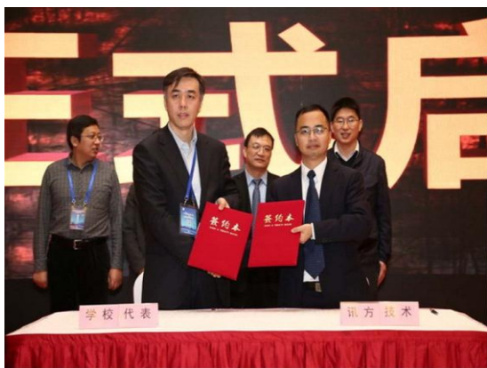
我校获批教育部产学合作、协同育人项目

为响应教育部关于深入推进产学合作、协同育人工作精神，学校申报的“云计算与大数据实训科研综合实验室”成功立项，并获得软硬件建设资助经费200万元。第二届“福思特杯”会计、税务技能大赛暨财经类专业创业实践教学研讨会成功举办，参会代表对提高财经类专业应用型人才的培养质量、高校实践教学前沿问题及学生就业问题等进行了深入的交流与研讨。为满足各专业学生实践实习需要，学校积极与多家企事业单位联系，新建数家实习基地。