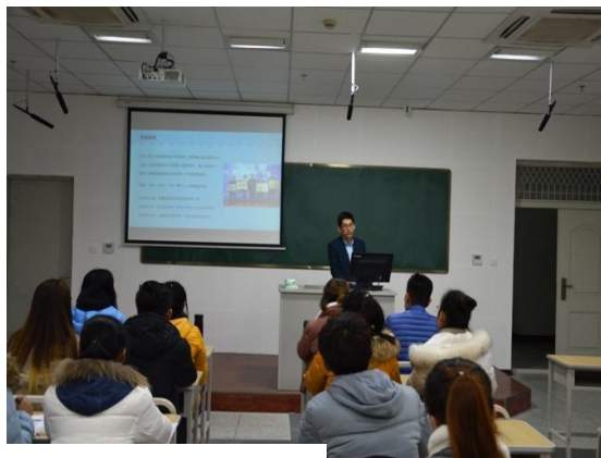
我校实施首届创业实验班