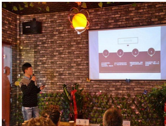
我校众创空间“逐梦创客”举办路演沙龙