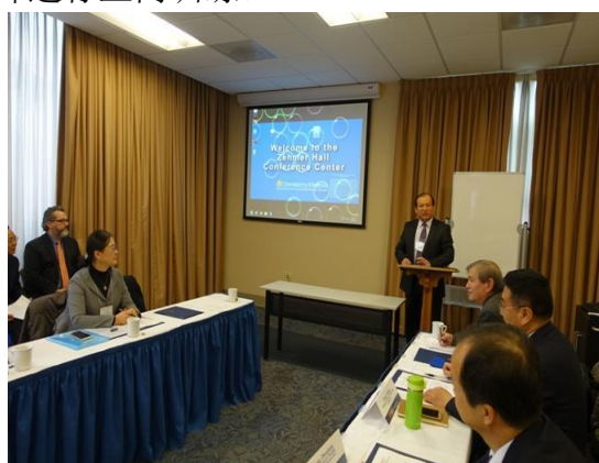
我校教师赴美开展“经济类课程翻 转教学法课堂设计与应用”培训班

2016-2017学年，学校共选派126人次教师赴国（境）外访学、交流、培训或进修学习，其中境外交流、培训、进修52人次，国内访学3人。发挥教师教学能力发展中心职能，大力开展校内教师培训，组织开展教学沙龙活动8期，围绕专业与课程建设、教学团队建设、国家通用语言文字教育教学改革等主题开展研讨；组织25名新入职教师进行上岗训练。