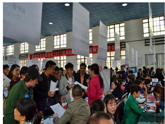
学校举办大型校园双选招聘会