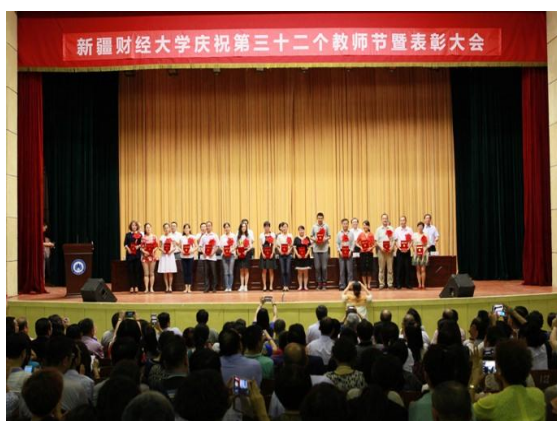
学校优秀教学质量奖、优秀教学管理奖获得者教师节大会上接受表彰