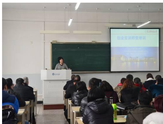
我校举办首届创业课程教师 教学能力提升培训班