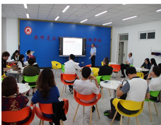
我校举办教学沙龙活动