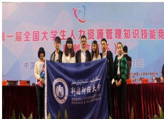
我校学生在 2016 年全国大学生人力资源管理知识技能竞赛”总决赛中获全国二等奖