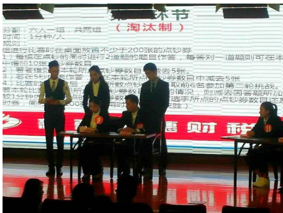
我校举办第五届“民族团结杯”点钞大赛

学校举办丰富多彩的第二课堂活动，营造良好的学术、文化氛围。2016-2017学年，举办各类文化、学术讲座273场，本科生课外科技、文化活动项目总数达186个。为了培养学生多读书、读好书的良好习惯，引导学生转变信息获取的观念和方式，图书馆举办了18场入馆教育和培训，与各大数据库公司为广大师生举办了6场数据库培训系列讲座，3000余人次学生参加了培训。