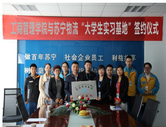
我校与苏宁物流达成合作协议， 举行实习基地挂牌仪式