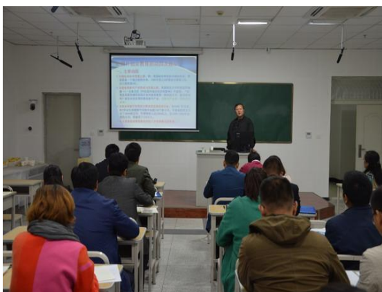
我校承办新疆高校创新创业 教育课程师资研修班

为促进自治区高校和我校创新创业教育教学改革，以转变教学理念、提升创新创业教学能力为核心，承担并圆满完成了自治区高校创业教育课程师资研修班培训工作，来自全疆 16 所本科、高职院校的 28 名教师完成了 56 个课时的研修计划顺利结业。成功承办第三届新疆“互联网+”大学生创新创业大赛工作会议暨专项师资培训会，来自全区 35 所高校代表、指导教师以及相关企业代表近 200 人参加。举办我校首届创业课程教师教学能力提升培训班，组织开展了创业教师模拟教学实训与教学研讨等活动，在我校建立起一支数量较充足、结构较合理并相对稳定的跨专业通识性创业课程教学团队。