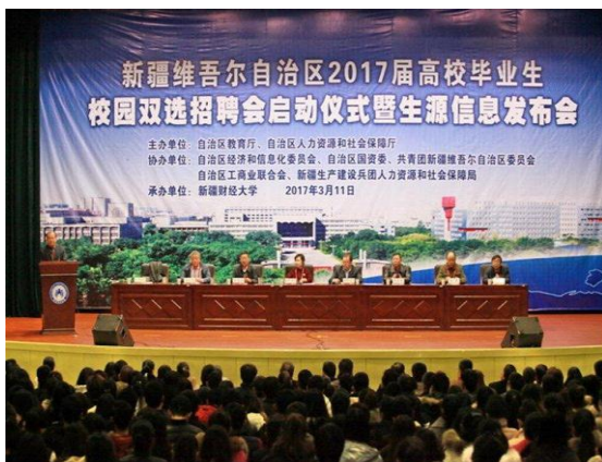
自治区 2017 届高校毕业生校园双选招聘会启动仪式暨生源信息发布会在我校举行

组织开展各种类型的招聘会 70 余场，其中大型招聘会 2 场、中型招聘会 19 场、各类小型专场招聘会 54 场；邀请用人单位 720 余家，提供就业岗位 12900 余个。推进就业服务信息化建设，充分利用校园就业网站、QQ 群、微博、微信等媒介发布招聘信息 600 余条；继续开设 SYB 创业培训班，培养学生的创业意识，激发创业激情，拓宽就业渠道。2017 届毕业生初次就业率 74.18%。