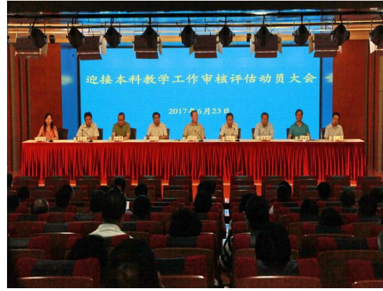
学校召开迎接本科教学工作审核评估动员大会