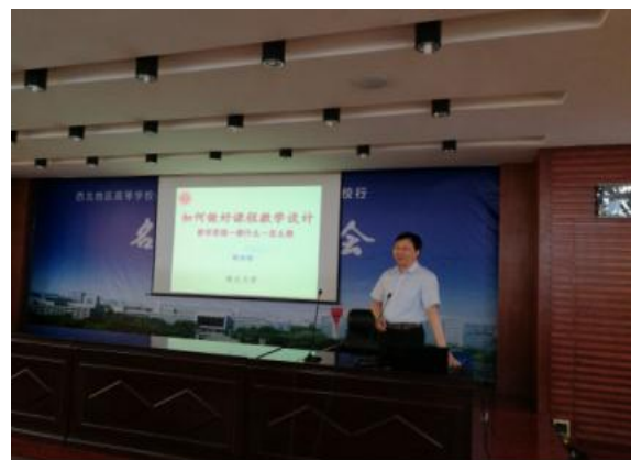
学校举办“名师西部高校行”名师报告会