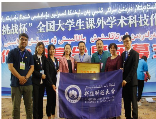
我校学生参加第十五届“挑战杯”全国大学生课外学术科技作品竞赛新疆赛区决赛

2016-2017 学年，学校积极组织学生参加各级各类学科竞赛，获得省部级以上竞赛奖励 337 项。在 2017 年度全国大学生英语竞赛（NECCS）中，我校荣获 2017 年全国大学生英语竞赛新疆赛区团体奖（A 类）第二名，获国家级奖项人数共计 172 人，其中，国家级特等奖 1 人，一等奖 11 人，二等奖 58 人，三等奖 102 人。第十五届“挑战杯”全国大学生课外学术科技作品竞赛新疆赛区决赛中，我校获得二等奖 1 项、三等奖 1 项。在中国大学生计算机设计大赛、全国大学生人力资源管理知识技能竞赛、“京东杯”第二届全国大学生物流仿真设计大赛、2017 第五届全国物流管理挑战赛、“巽震杯”第九届全国旅游院校服务技能大赛等多项竞赛中获得佳绩。